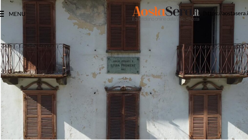
Lascito Proment – Atlante digitale del patrimonio architettonico sottoutilizzato della Valle d'Aosta