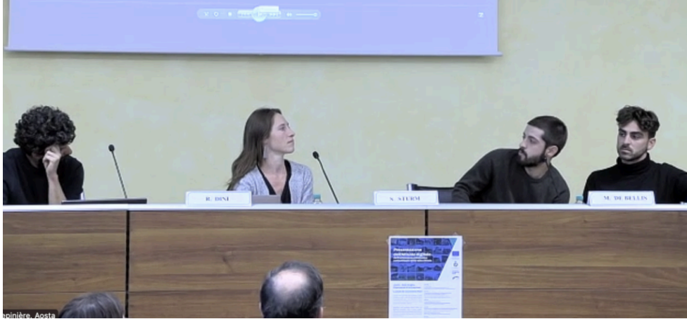
Presentazione dell'atlante digitale

Il progetto nasce dallo “Studio per la rigenerazione del patrimonio edilizio alpino sottoutilizzato nel territorio della Valle d’Aosta”, realizzato nell’ambito del Progetto PNRR Courmayeur Climate Hub e avviato nel 2021 dal dipartimento di Architettura e Design del Politecnico di Torino con la collaborazione della Fondazione Courmayeur Mont Blanc , del Celva e del Gal Valle d’Aosta.